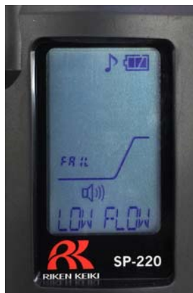
故障警報表示例(流量低下)

「故障警報」は、本器内での異常動作を検知したときに、ブザー鳴動・警報ランプ点滅で、故障警報を発報します(故障表示は右表参照)。流量低下警報は原因が解消され、流量が復帰した後、 MODE ボタンを押すことにより解除できます。